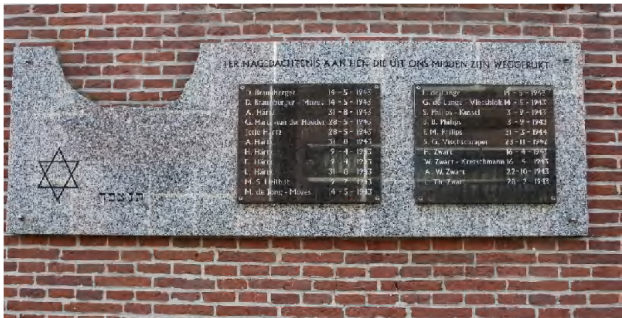
De plaquette op de muur van de synagoge