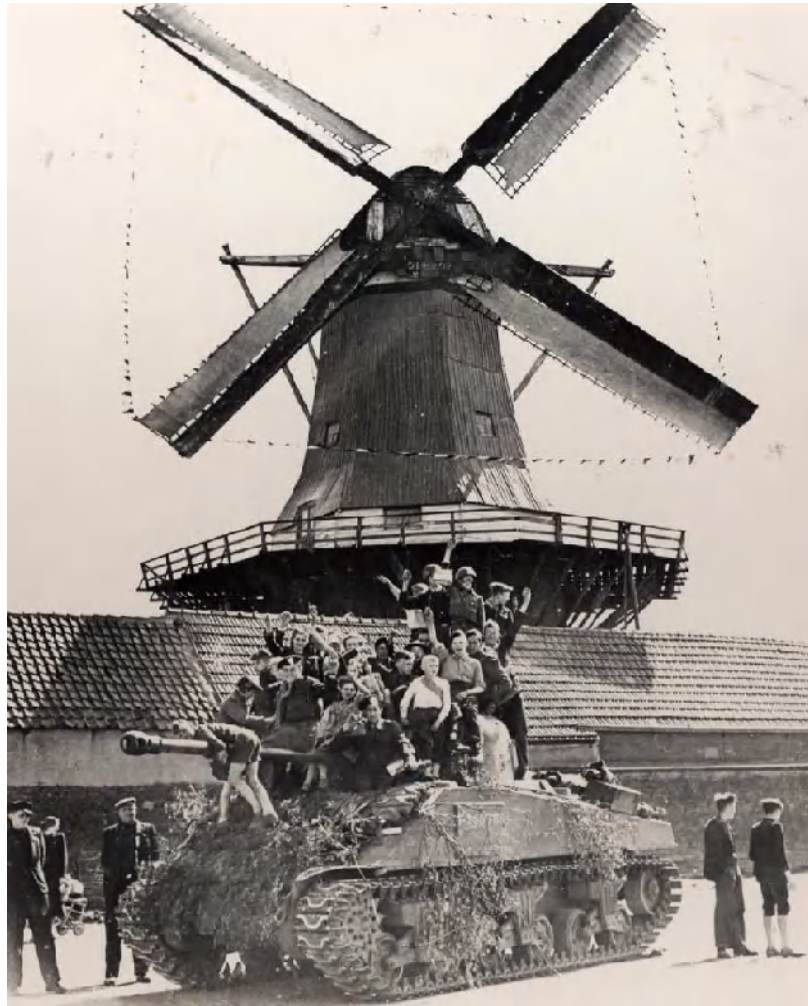
Een Canadese tank bij molen De Hoop

Overal in de stad werd uitbundig feestgevierd. Anna, Peter en hun ouders deden natuurlijk ook mee. Ze mochten een stukje meerijden bovenop een Canadese tank, net als op de beroemde foto van de bevrijding van Harderwijk die op de voorkant van deze lesbrieven staat. De oorlog was eindelijk afgelopen. Gelukkig!